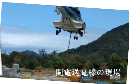
関電送電線の現場