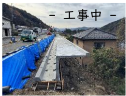
- 工事中 -