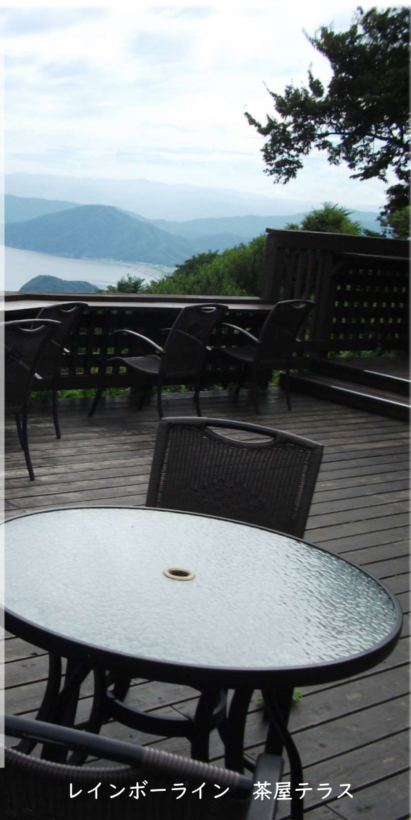
レインボーライン 茶屋テラス

四季折々の姿を楽しめるレインボーライン山頂公園では、三方五湖を一望することができます。この機会に神秘的な景色を一度感じてみてはいかがでしょうか？